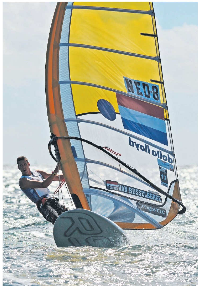
Surfer Dorian van Rijsselberghe: „Dit is bepaald door hoge piefen in rubberboot, maar het is zoals het is.“